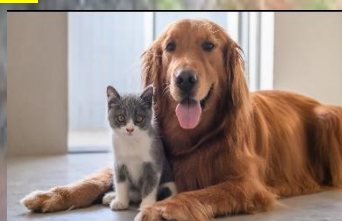
собаки и коты